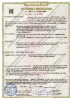
CU-TR符合性证书 ( CU-TR COC )

海关联盟认证Custom Union Technical Regulation Certification，又称海关联盟技术规范认证，其认证标志为EAC，因此英文简称CU-TR认证或EAC认证。